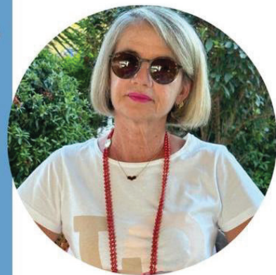
Michela Acconci Scuola Primaria

Ecco il perché della mia candidatura e la scelta di questo Sindacato che ha fatto proprie le lotte per una SCUOLA DEMOCRATICA, LIBERA che sappia dare dignità' alla professione degli insegnanti e che passi anche da una " giusta" riqualificazione economica.