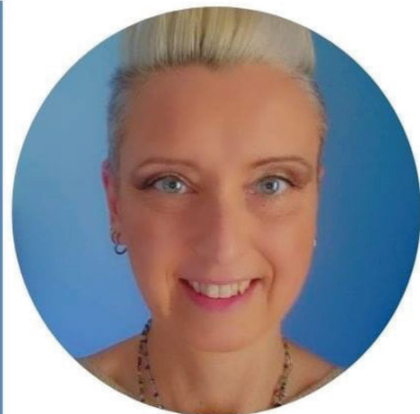
MARTA ERODIANI SCUOLA PRIMARIA

Sono fermamente convinta che la scuola sia un luogo di crescita fondamentale per gli studenti e che il benessere di tutti i componenti della comunità scolastica sia un prerequisito per il successo formativo. Per questo, se eletta al CSPI, mi impegnerò con tenacia e passione a rappresentare gli interessi di tutti, lavorando per un sistema scolastico sempre più inclusivo, equo ed efficiente."