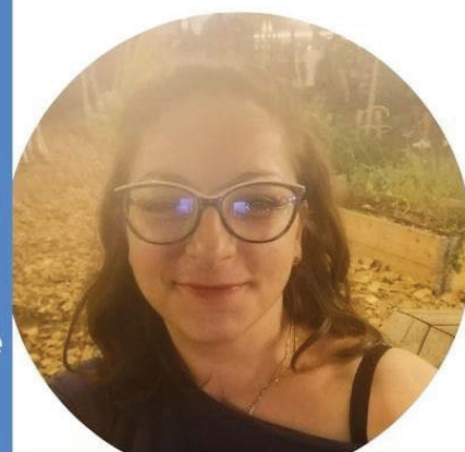
MARIAPINA BALESTRA SCUOLA SECONDARIA DI PRIMO GRADO

È necessario che la scuola riprenda la sua centralità nella società contemporanea e che riacquisti il suo valore. Noi ci impegniamo perché ciò avvenga.