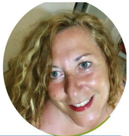
EMILIA MEZZATESTA SCUOLA PRIMARIA

Ho accettato di candidarmi in questa lista perché credo nelle cose umili, ho sempre lottato per il riscatto sociale e la dignità della persona, promuovendone la crescita personale e sociale. Conosco il mondo della scuola paritaria, della scuola pubblica e della cooperazione sociale. Ogni giorno della mia vita dal 1990 l'ho vissuto educando, empatizzando con alunni, colleghi, famiglie, associazioni. Ritengo che la nostra presenza nel mondo del sindacato dei "Grandi" possa fare la differenza. Se sei sfiduciato/a e non ti senti ascoltato/a sappi che tanti docenti sono nella tua stessa condizione. Fai un passo di fiducia, aiutaci a riappropriarci della dignità del ruolo, ormai perso nel tempo.