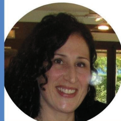
GIOVANNA TESTA SCUOLA PRIMARIA

Credo che il CSPI possa essere uno strumento per dare voce ai docenti e per costruire una scuola migliore per tutti. Se anche tu credi in questi valori vota per me, vota la lista "NOI SCUOLA BENE COMUNE"!