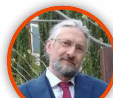
MASSIMO TAVOLA SECONDARIA DI PRIMO GRADO