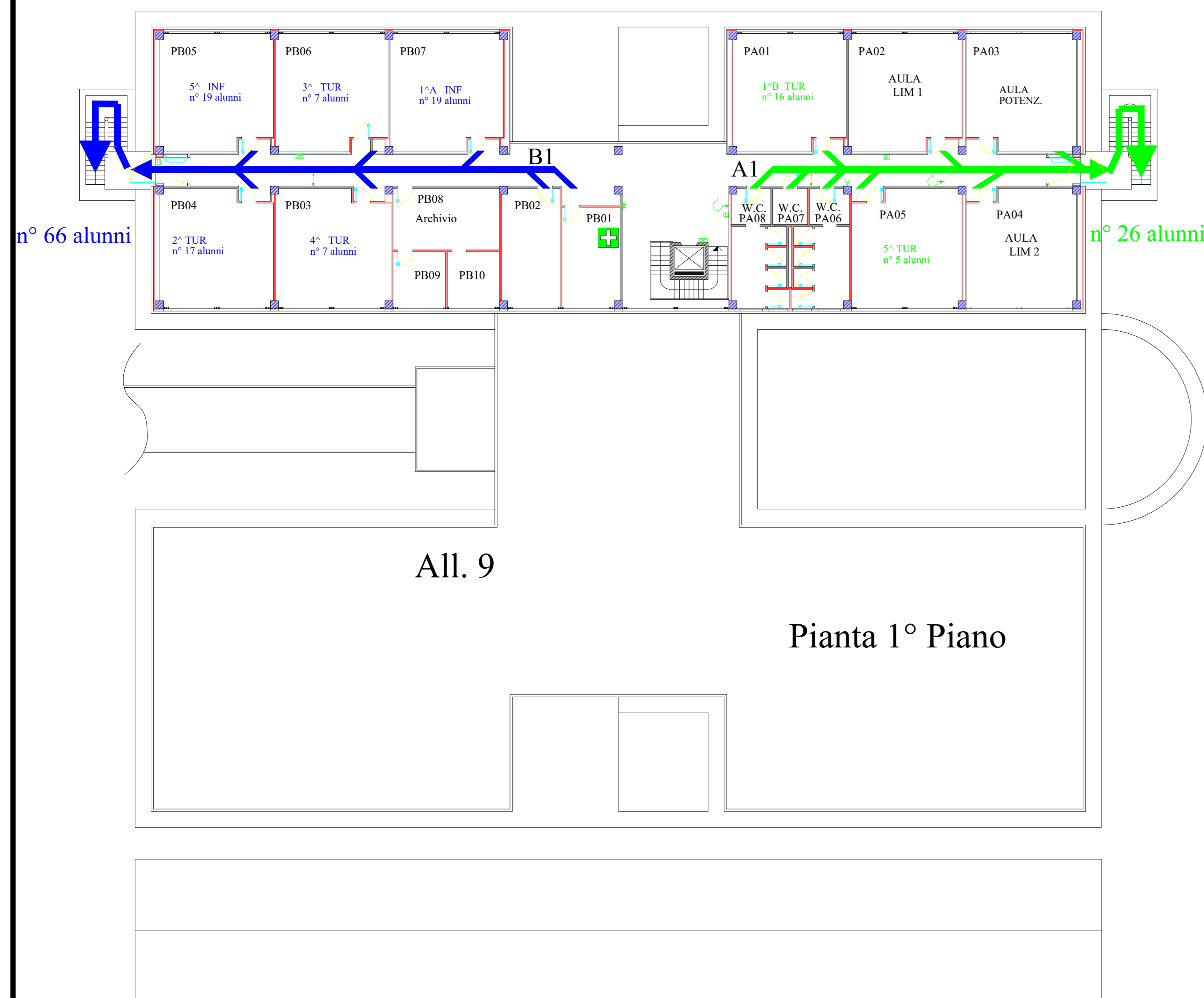
All. 7 Planimetria Generale Evacuazione - Zone di Raccolta